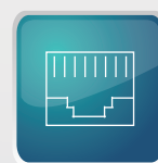
Tarjeta de Red