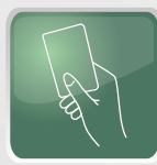
Tarjeta de Proximidad