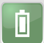
Batería de Respaldo