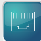
Tarjeta de Red