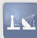
Opcional Wi-Fi o GPRS